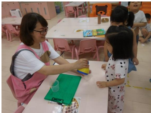
我會說「請」「謝謝」「對不起」