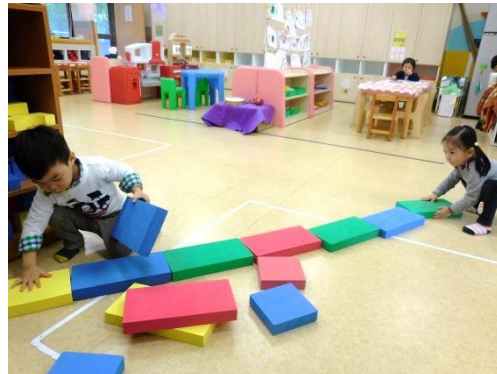
積木區-發泡積木建構