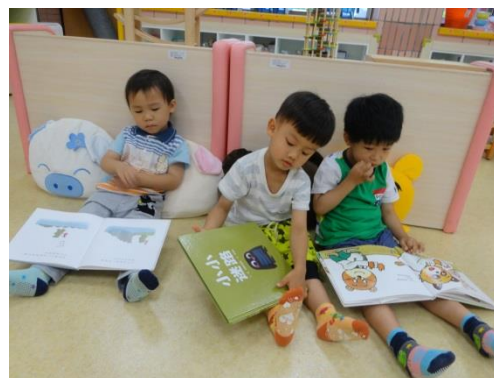
語文區舒適的閱讀空間