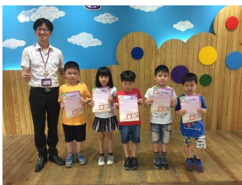
校長頒發閱讀小博士證書