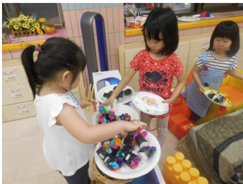
扮演區-壽司買賣遊戲

教室內提供多樣性的學習角落，幼兒能在學習區內依自己的興趣自由運用不同的學習材料，培養其主動及獨立學習的精神，也提供幼兒表達自我與相互學習的機會。