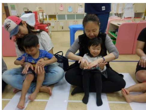
母親節-幫媽媽擦護手霜