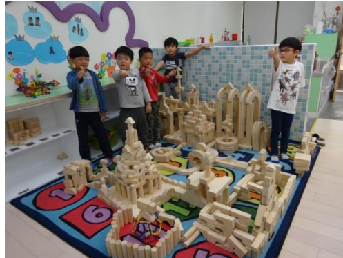
積木區-木頭積木建構