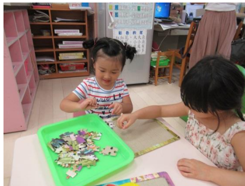
語文區-拼圖好好玩