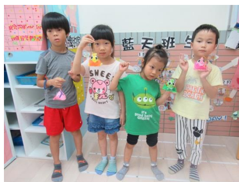
端午節-粽子香包製作