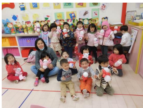
聖誕節-製作聖誕小雪人